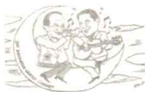
印尼第二屆團結內閣大和諧 右為蘇西洛總統，左為在野黨領袖 Aburizal Bakrie。

KABINET BERSATU 時曾經公開承諾一年後他要親自考核各部會首長表現及政績，以決定是否繼續留任或更換新人接替，因此，印尼各主要媒體、民意調查機構、學者專家等不約而同的紛紛發表對蘇西洛政府團隊一年的施政成果，他們的重點和焦點不同，因此所發表的觀點也不相同。筆者擬就從許多不同的觀點，歸納出若干主要的評論和分析。