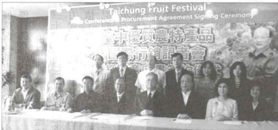
台中農會與印尼四家超市簽署意向書後合影

台灣梨已正式進入印尼 為推廣台灣中部水梨等農特產品，台中縣長黃仲生與台中市長胡志強聯袂抵雅加達，將台灣高品質的農特產介紹給印尼民眾，希望能獲得熱烈迴響，為台中地區的農產品打開一條通路。