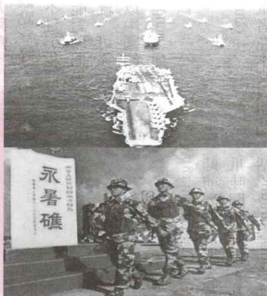
上圖：美派出航母聯合十四國進行二〇一〇環太平洋聯合海上軍演。