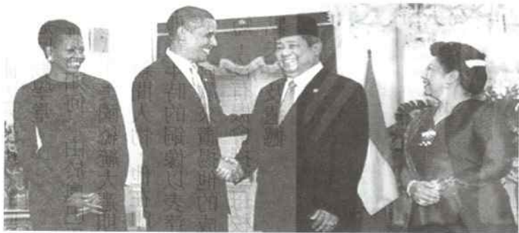
印尼蘇西洛總統暨夫人設國宴歡迎美國奧巴馬總統暨夫人

筆者曾於二〇〇八年十一月廿四在印尼星洲日報 (Harian Indonesia) 撰寫的「奧巴馬情結」專欄文章，主