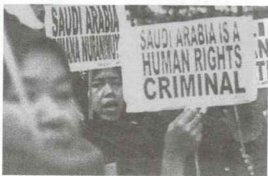
印尼民眾前往沙國大使館抗議

由於海外印勞被顧主肆虐的不幸事件層出不窮，已經無形中傷害了印尼人民的尊嚴，因此，有人主張一律停止輸出印勞，以維護國家民族在國際上的良好形象和尊嚴。這種民族情操值得欽佩和同情。然而，只要印尼國內就業市場無法吸收龐大的求職人口，只要印尼經濟結構和體制仍無法短期內轉型，只要家庭生育計劃無法全面貫徹，只要教育仍未能全國普及，只要國外仍需要印勞來紓解他們面臨的人口老化的社會問題等等，無論誰在印尼執政，短期間恐不易禁止「勞力輸出」。因此要改善印勞的處境，只有透過法律保障、外交保護與相關國家重新簽訂對顧主和印勞雙方都互相有益的契約。如此，印勞不但是麻煩製造者，反而爲促進國民外交的幫手。當然國外仲介公司也