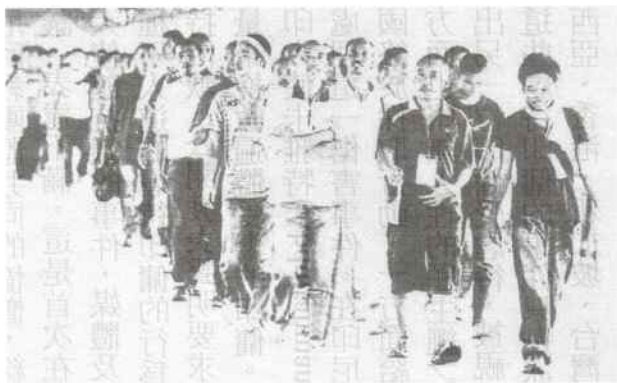
二〇一〇年八月數百名非法印尼勞工被馬來西亞政府驅逐出境

必須改善他們引進印勞、管理印勞、保障印勞的權益等措施，讓印勞可安心工作，人權也受保護。