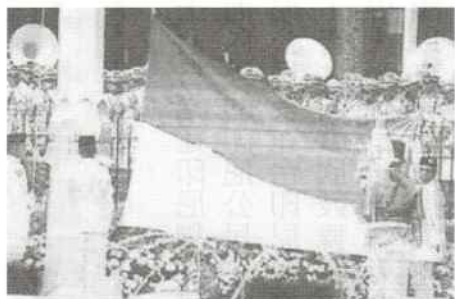
今年印尼總統府廣場國慶升旗典禮

印尼是東協十國之中唯一受邀加入 G-20 高峰會議的東協成員，這對印尼全國上下是莫大的光榮和驕傲，顯示印尼現在與世界主要工業發達國家已經平起平坐，印尼做為主權獨立的東南亞大國似乎可以在國際主要經濟論壇正式為東協國家的發言人或代言人，這更鞏固了印尼在東南亞區域的