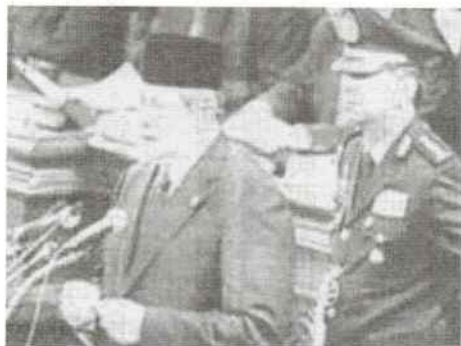
尤托總統發表國情諮文

基金會 (IMF) 深怕印尼經濟全面瓦解，馬上派員來印尼，表示願意向印尼伸出援手，但另