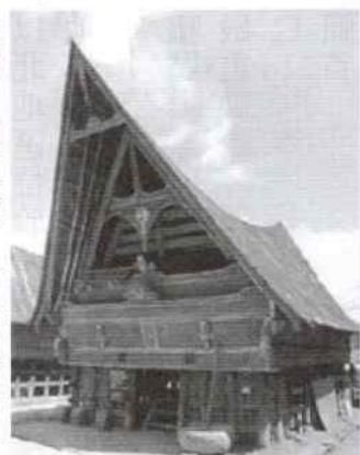
傳說，巴達克人大約在一千四百年前是來自中國雲南及泰國

北部。他又說，有位巴達克人工程師到泰北旅遊，發現當地地方語言有很多與巴達克語可以相通，可能巴達克人就是當年雲南的山擺夷。中國自古以來敵人都來自北方，北方胡人南侵，中原漢人南遷，於是原住南方的居民只有往赤道跑，部分到了蘇門答臘的多巴湖。他們所建的房屋和中國西南傳統房屋大致相同，共有三層，最底一層用厚木條圍起來飼養家禽家畜，第二層住人，第三層用來存放糧食及武器。去過雲南的旅客，看了他們的房屋，會有似曾相識之感。因為巴達克人祖先來自中國，為父系社會，所以有家族姓氏（爪哇人無姓氏），生活習慣上也有很多相類似的地方，他們吃豬肉，也吃狗肉，蛇肉，過去還吃人肉（戰俘及罪犯的肉），自從十八世紀基督教傳入後，才不再吃人肉。華人文化早在一千年前已開始