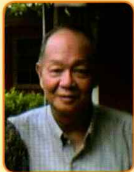
作者 ■ 三西博客

101大廈和信義計畫區，除了充分展現了臺灣經濟上的成就，也是臺灣物質文明的展示櫥窗。俗語云：「禮義生富足」，或說：「衣食足，禮義興」，這裡的「禮」，是禮儀教化，所以有「脩六禮以節民性」的說法，目的是要「導之以德，齊之以禮」，用現代的話說，禮與「文明」的意思很相似，就是要藉文明的修養，節制民性。