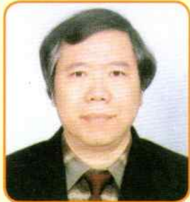
作者 ■ 廖世承

廣東大埔人，中山初中部畢業，一九六〇年返國升學，畢業於國立政治大學法律系，曾任《印尼僑聲》月刊副社長兼主編多年，服務教育界卅餘年，現已退休。