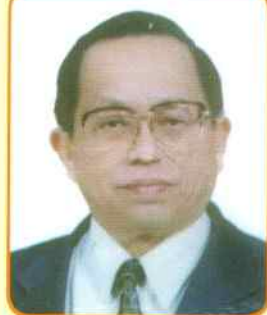
作者 ■ 何良泉

協會平時對外活動或對外公文來往，大都使用「中華民國印尼歸僑協會」名稱，口頭交談則簡稱為「印尼歸僑協會」。一般歸僑對「中華民國印尼歸僑協會」和「台北縣印尼歸僑協會」同在一處辦公，常以為是相